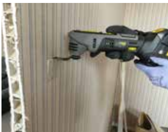
Idéal pour couper de la plaque de plâtre Perfect for plasterboard