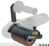
Rénovateur - Renovator MR 900-REX