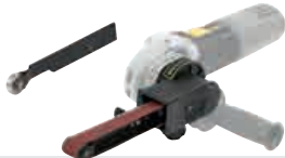
Ponceuse lime - Electric file MR 900-EFH