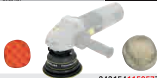
Ponceuse orbitale/ polisseuse Polisher MR 900-PP