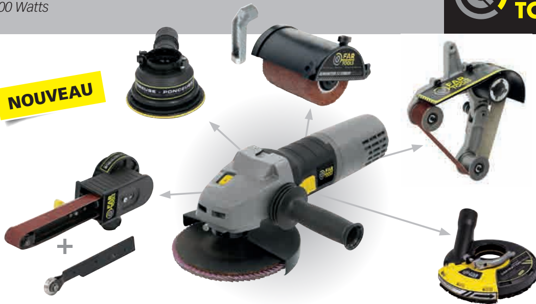
Ponceuse tube - Tube sander MR 900-TS