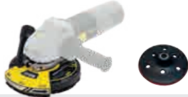
Ponceuse plâtre - Plaster sander MR 900-SH