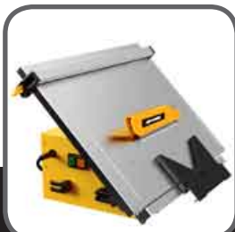
Table inclinable de 0 à 45° 0 to 45° tilting table 0 to 45° Tabla inclinable Mesa inclinável a 45°