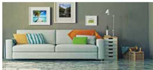
Dégâts des eaux, vide-cave Water damage, cellar vacuum

Filtere mousse - Foam filter - Filtros espuma - Filtros em esponja 3431541018532