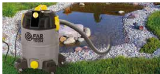
Nettoyage des plans d'eau et piscines Cleaning of water bodies and swimming pools